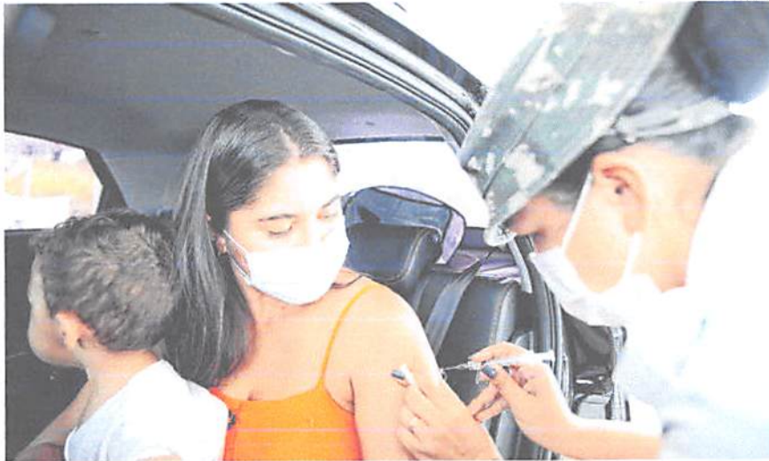
De acordo com a Secretaria Municipal de Saúde (Semus), cerca de 100 mil pessoas são esperadas para receber a segunda dose de forma antecipada